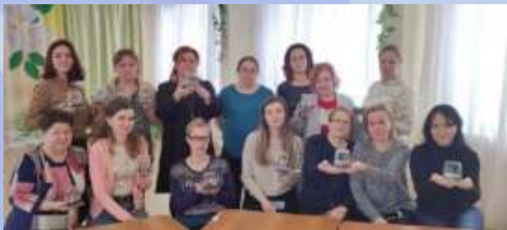
Мастер-класс «Знакомство с профессией фитодизайнер» «Мультипликатор» «Художник»