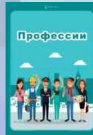
Методическая копилка игр, пособий, видео, художественной литературы