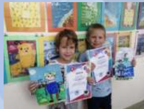
Участие в конкурсе «Мир профессий»