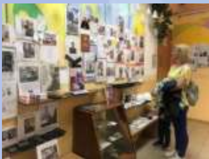
Выставка «Инструмент мастера»