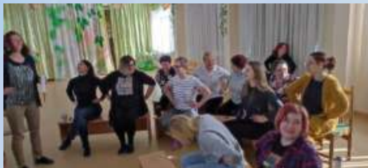
Рабочие собрания «Обсуждение системы работы по ранней профориентации»

Анкеты Опросы Диагностика Каждого ребенка 5-7 лет